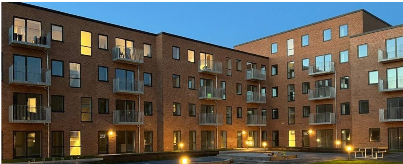
Afd. 30, Arresøvej i Risskov