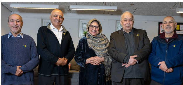
Til lykke til de nye trivselsagenter i Rosenhøj